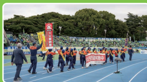
防火キャンペーン