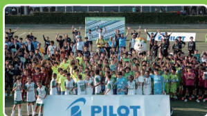
国際小学生サッカー大会