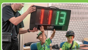
小学生お仕事体験