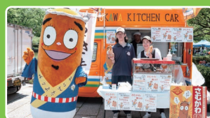
ホームタウンブース